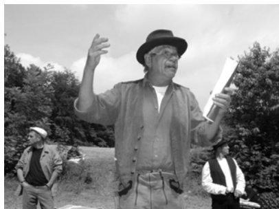
Bilder aus den Proben