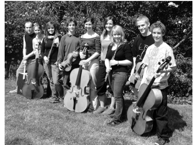
Die jungen Musikerinnen und Musiker