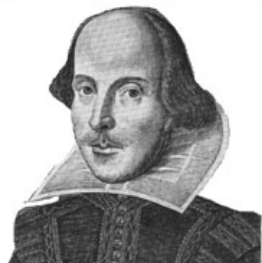
William Shakespeare, 1564–1616.

Zwüsche Dorf und Aare wärde sich verpaare: