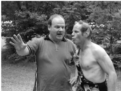
Bilder aus den Proben