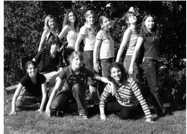
Die Elfen im Element (es fehlt Tabea Iseli)